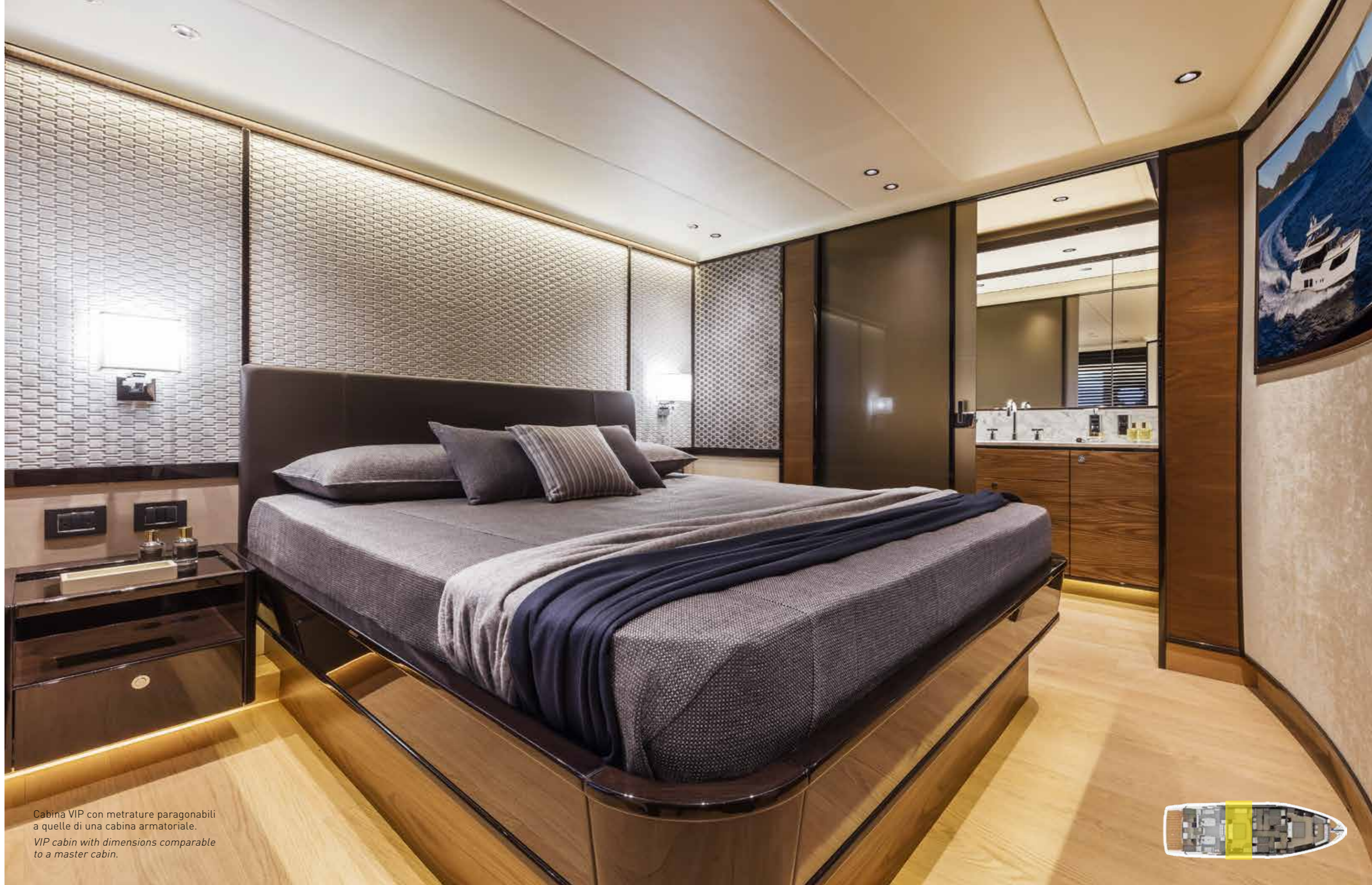
Cabina VIP con metrature paragonabili a quelle di una cabina armatoriale. VIP cabin with dimensions comparable to a master cabin.