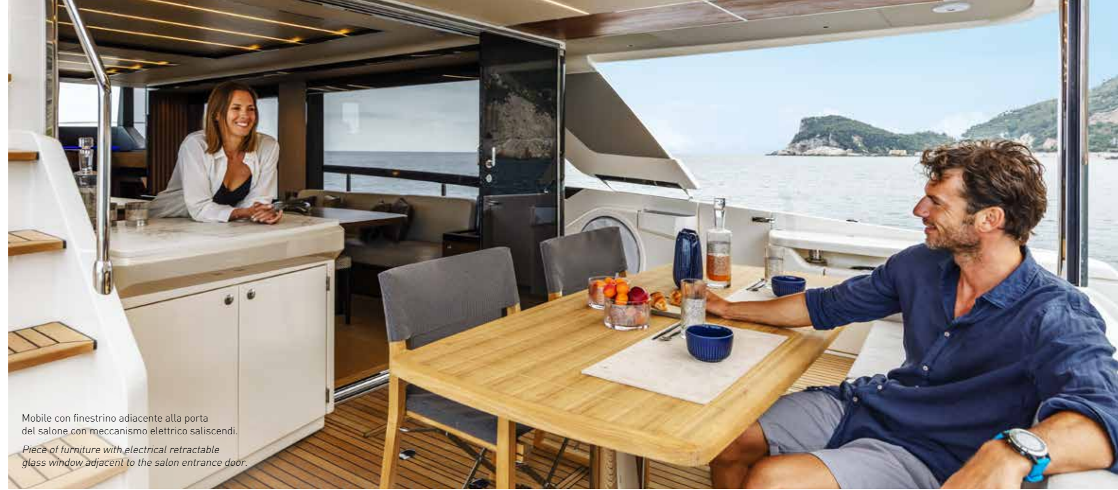
Mobile con finestrino adiacente alla porta del salone con meccanismo elettrico saliscendi. Piece of furniture with electrical retractable glass window adjacent to the salon entrance door.

“QUANDO HAI SPAZIO È PIÙ FACILE PERDERSI NEI PROPRI PENSIERI.”