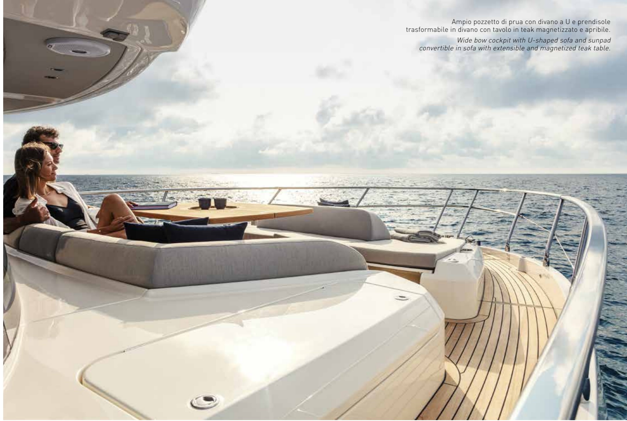
Ampio pozzetto di prua con divano a U e prendisole trasformabile in divano con tavolo in teak magnetizzato e apribile. Wide bow cockpit with U-shaped sofa and sunpad convertible in sofa with extensible and magnetized teak table.