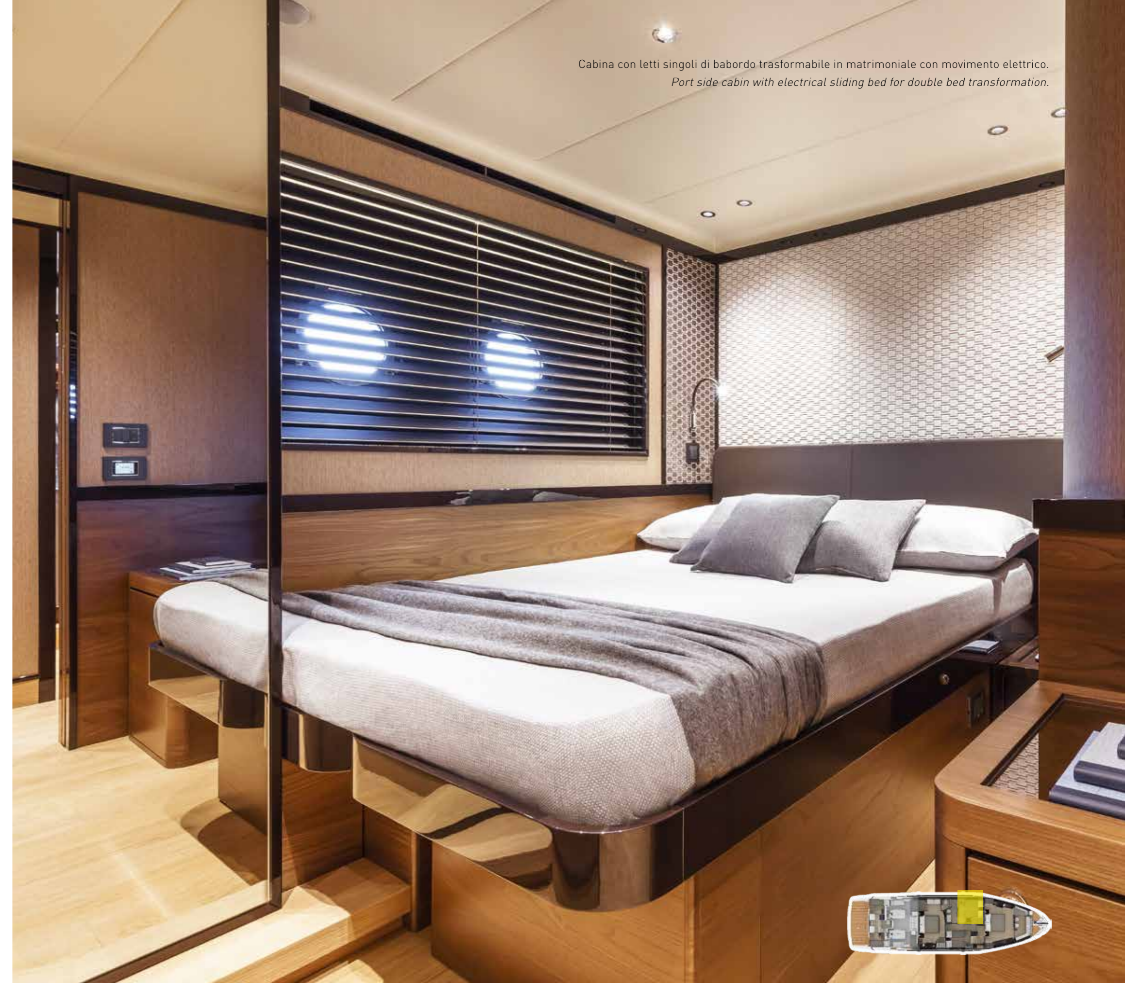
Cabina con letti singoli di babordo trasformabile in matrimoniale con movimento elettrico. Port side cabin with electrical sliding bed for double bed transformation.