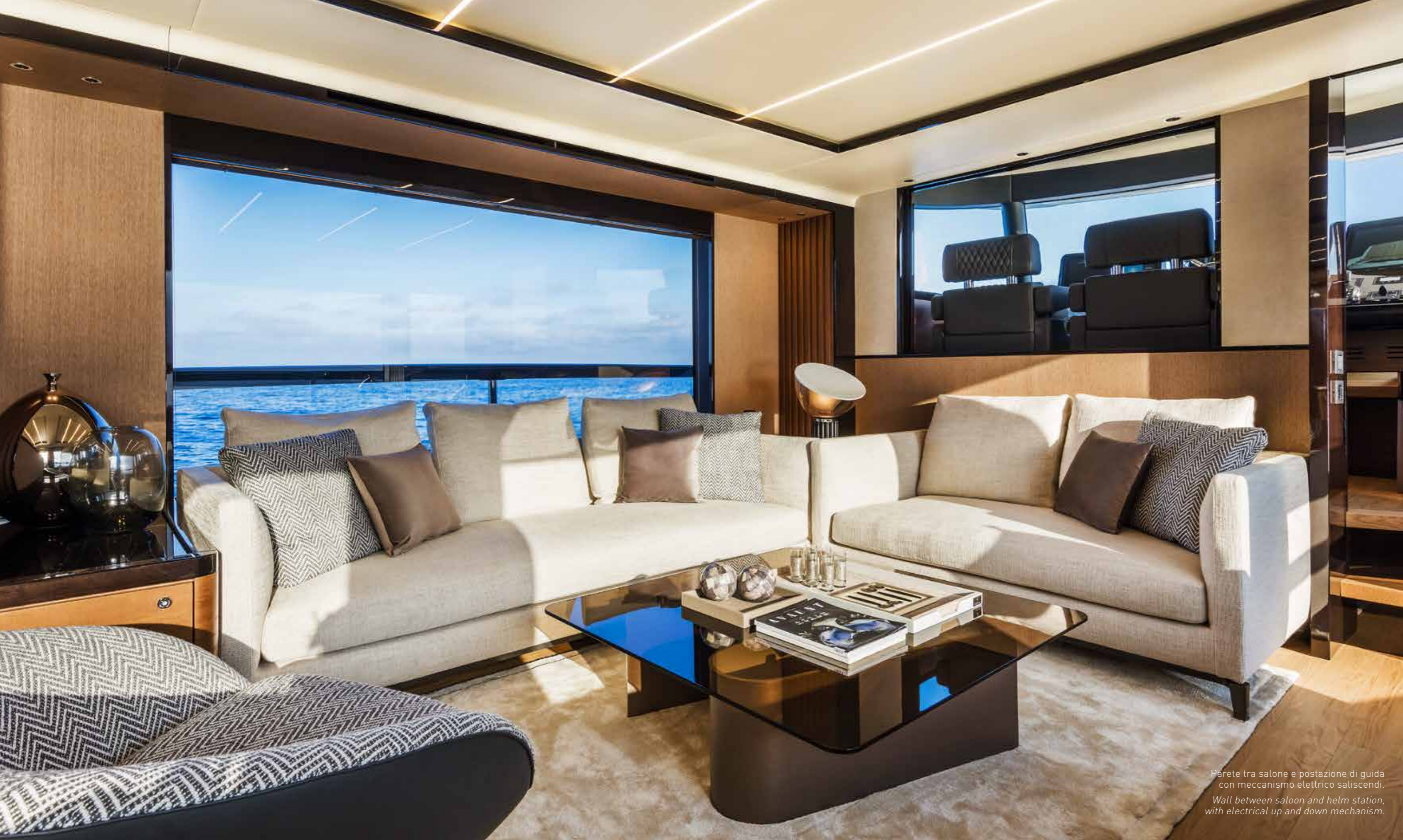
Parete tra salone e postazione di guida con meccanismo elettrico saliscendi. Wall between saloon and helm station, with electrical up and down mechanism.